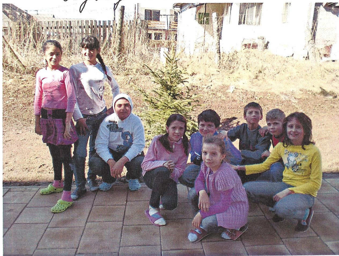
Aktivita č. 2 Kyslík dážd'