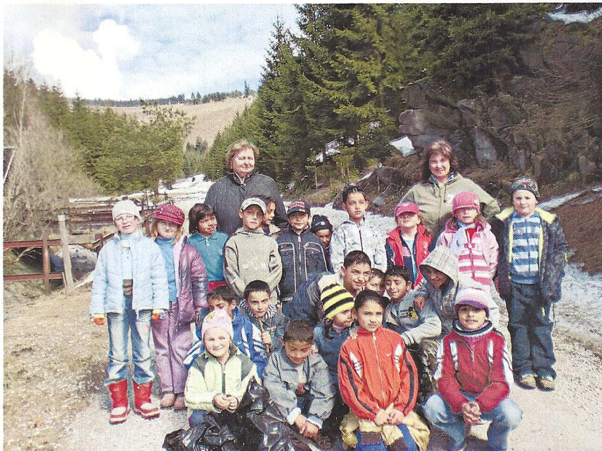
Malý žurnalista d.) Čistíme brehy potokov